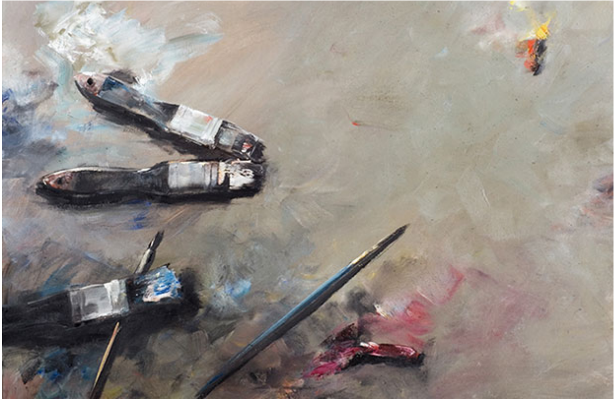
Frauke Gloyer, Palette mit Pinseln, o.J., Öl auf Leinwand, 50 x 70 cm