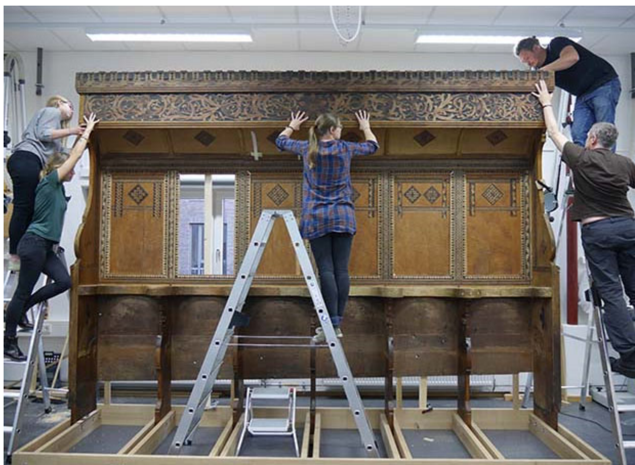
Probeaufbau des Tobsdorfer Chorgestühls in den Werkstätten der HAWK