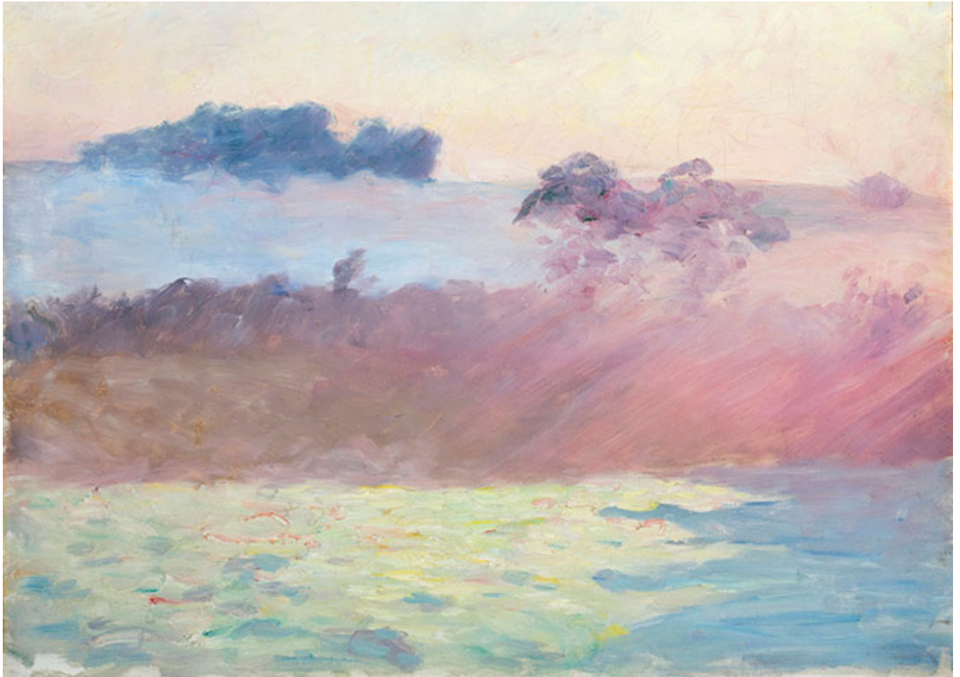
Hans Olde d. Ä., Morgennebel