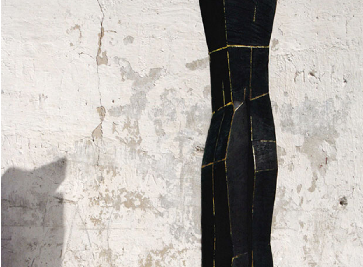
Modell der Bronze „Geflecht“ von Andreas Theurer (Ausschnitt)